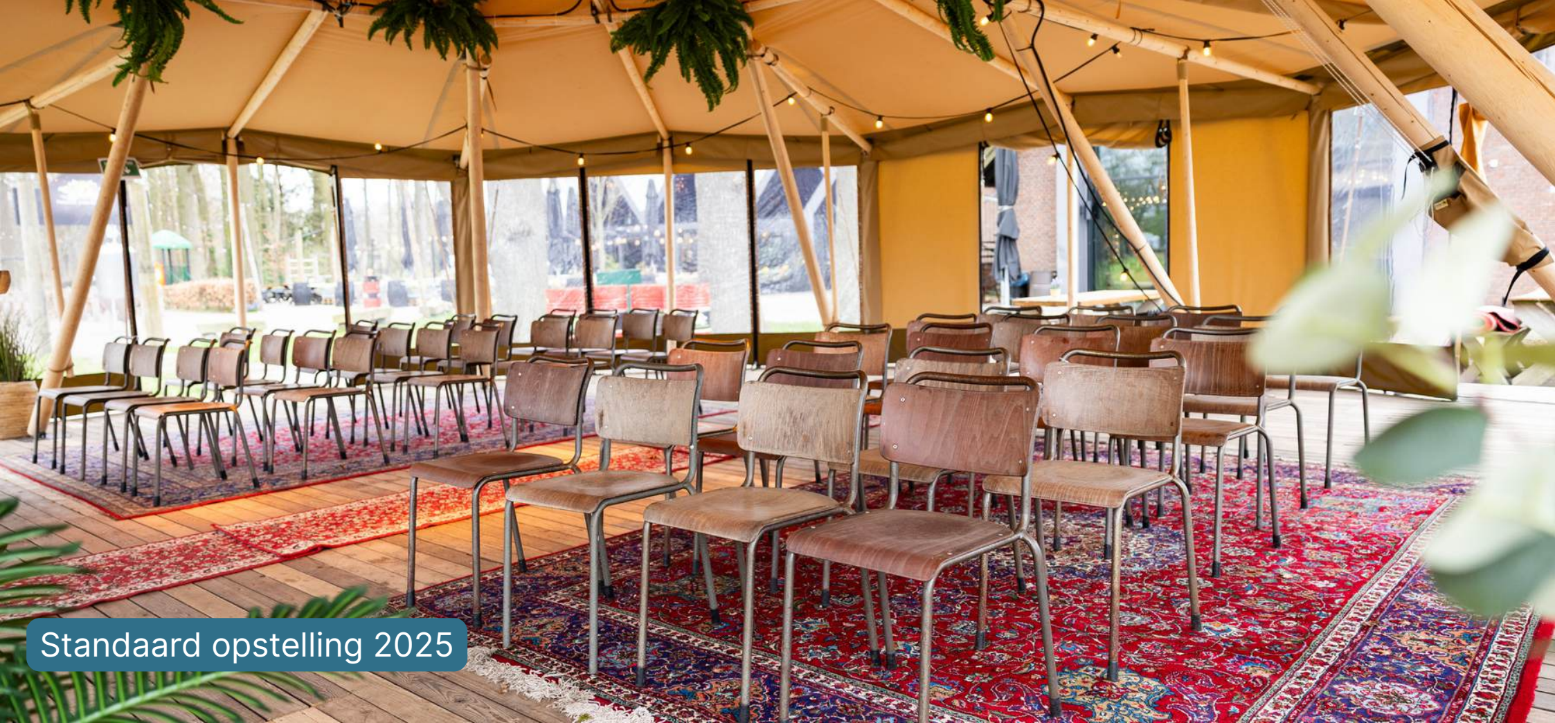
Standaard opstelling 2025